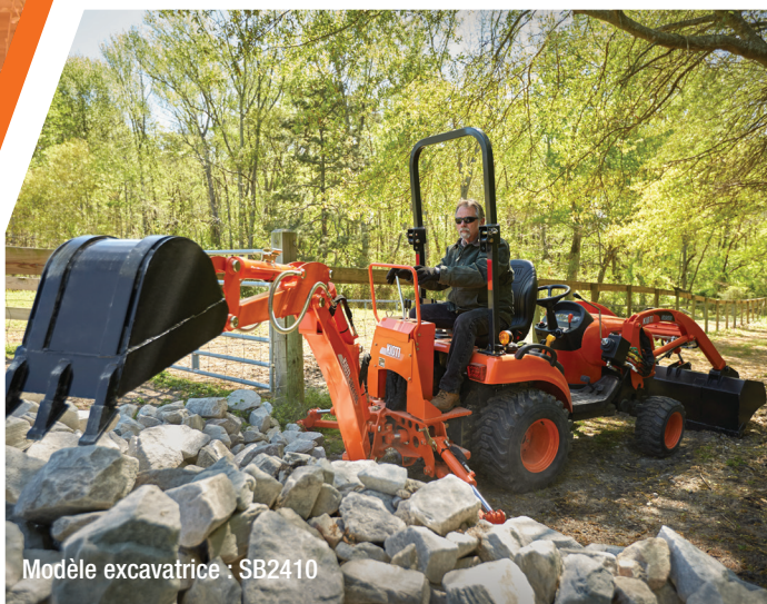
Modèle excavatrice : SB2410